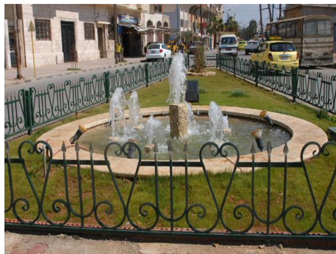
A Square in Tartous city