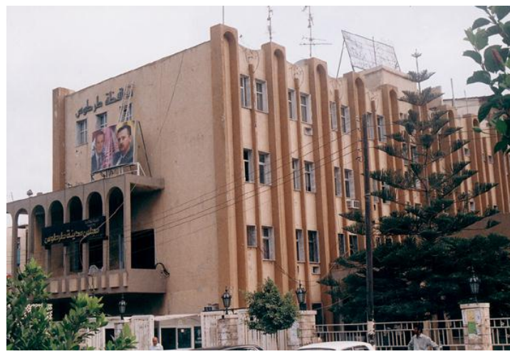
The Municipal palace