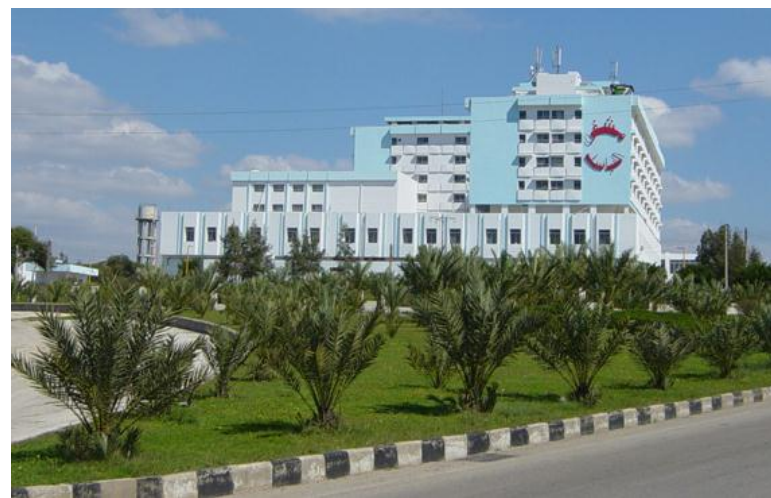
Al Bassel Hospital