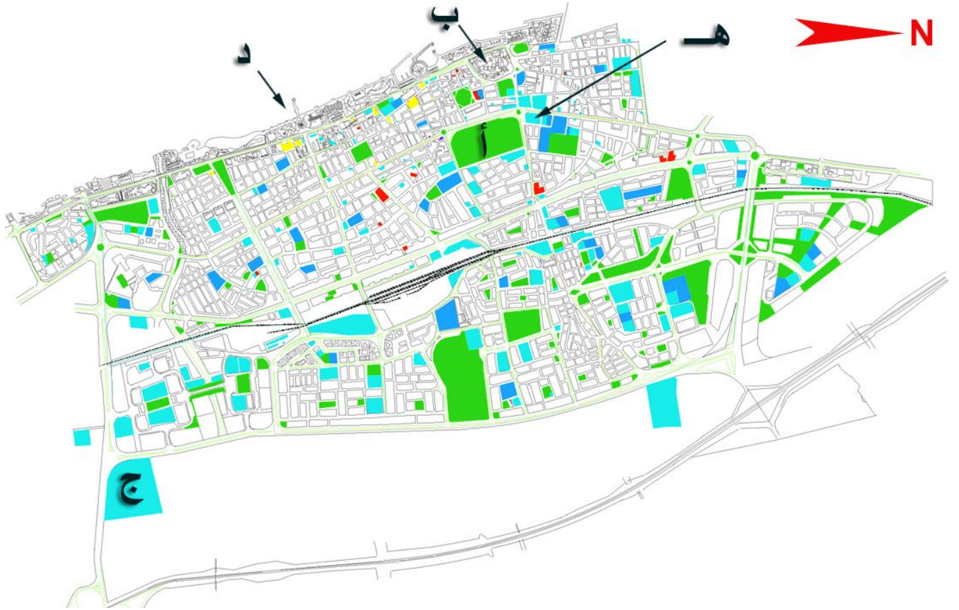
Master Plan for Tartous City