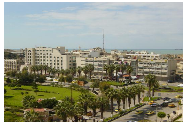
Parks in Tartous